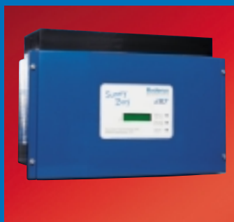
Sunny Boy Wechselrichter für die Umwandlung des Gleichstroms in Wechselstrom.

Die direkte Verbindung eines Generators mit einem gleichstrombetriebenen Verbraucher ist der einfachste Aufbau einer photovoltaischen Anlage. Der Generator des Photovoltaiksystems Logasol PV wird durch einen Sunny Boy Wechselrichter